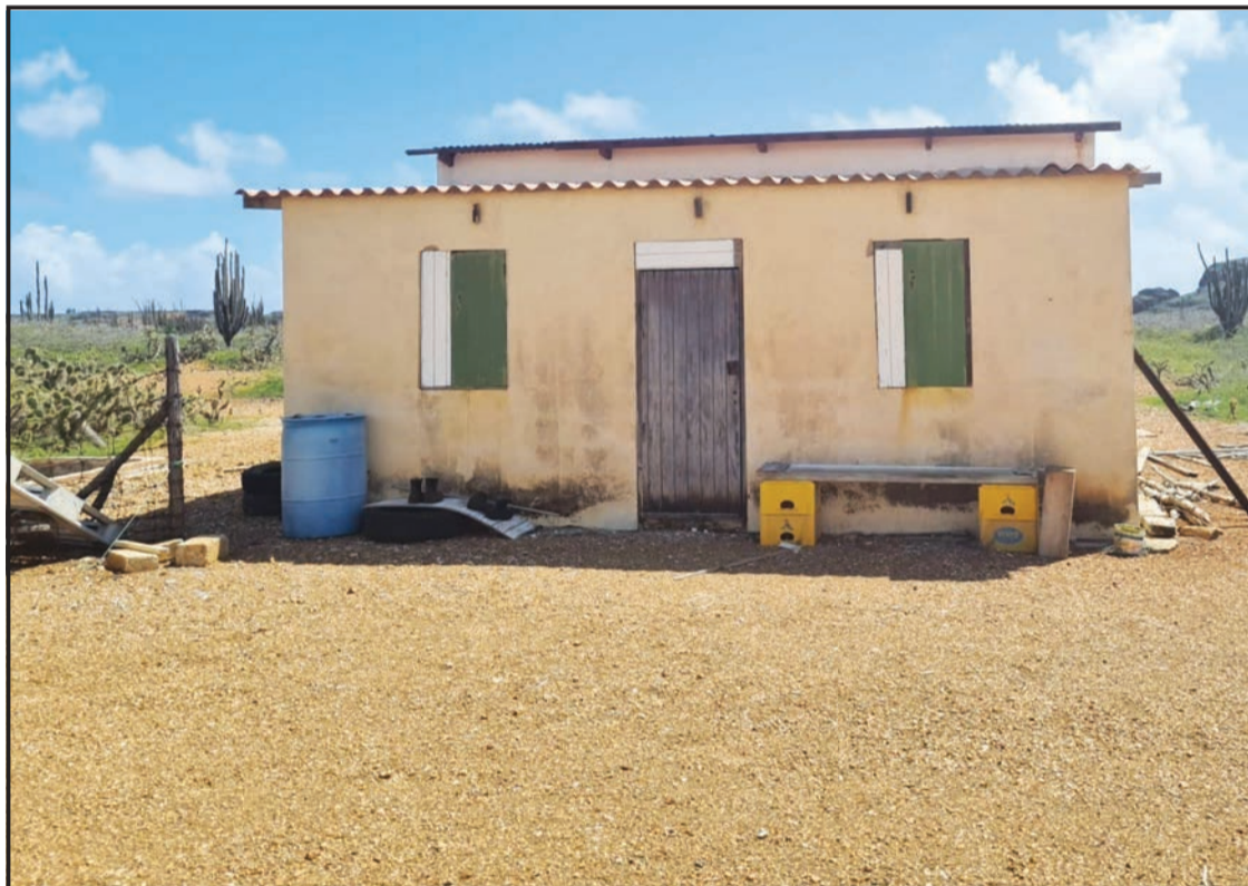
Kas di kunuku den Washington, den e parti Kunuku di Sabana, na unda a haña kurpa di Rodi.

por a landa, a skapa, miéntras ku Goi ku por a landa a hoga.